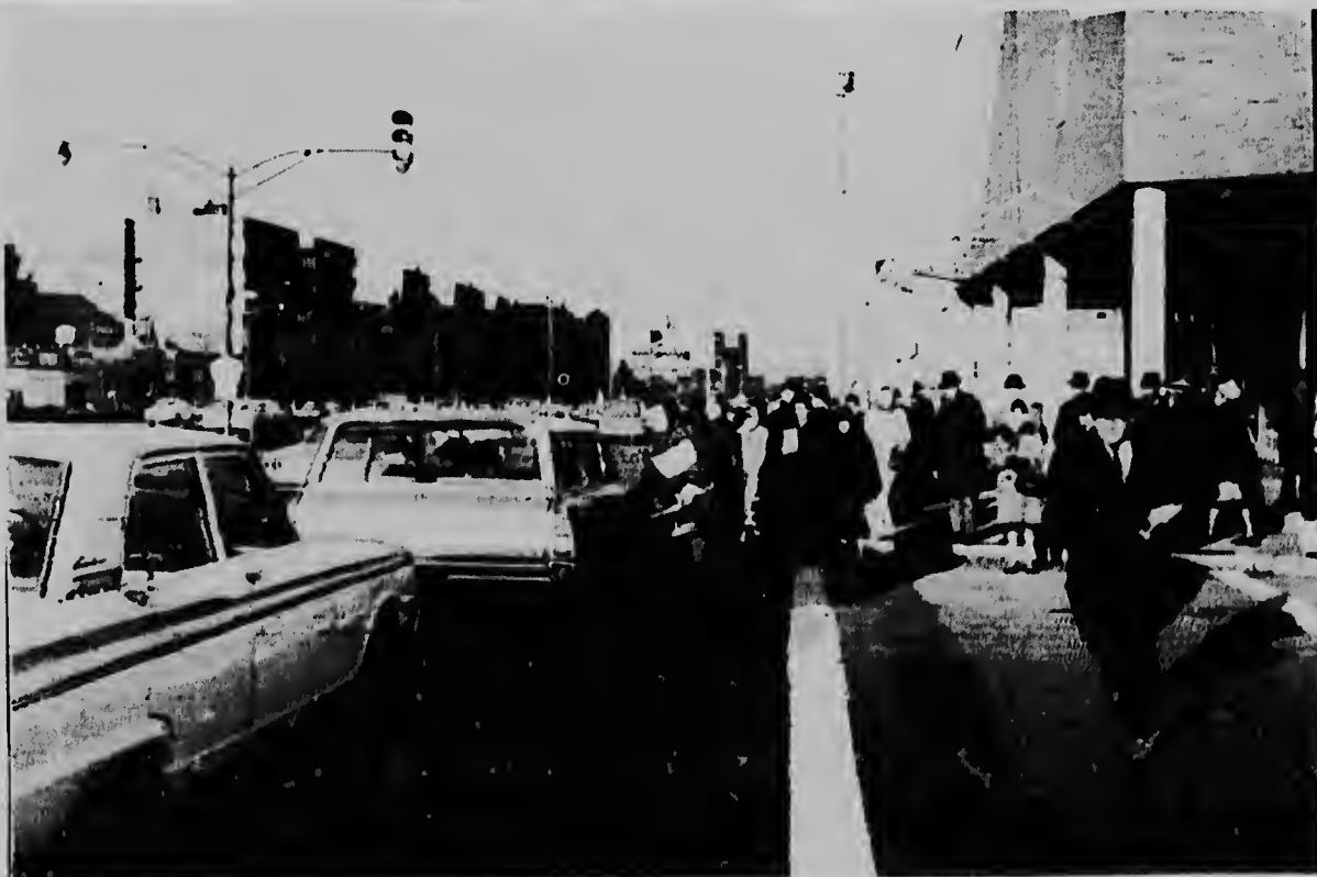
NEW YORK-- Riba e foto aki nos por mira algun trahador riba un caya di New York ta buscando transporte pa hiba nan trabao. Algun compania a anuncia cu si e trahadornan no bin traha anto nan lo no paga nan e dianan. Mientras tanto e dirigente welgista ta interna den un hospital di New York a consecuencia di un ataque cardiaco cu el a sufri den prison.

NOORD - Un chauffeur di bus a keda man na cabez diarazon ora cu un persona kende el a transporta for di Oranjestad pa Noord a baha for di e bus, cu cahita di placa den su poder. E chauffeur a keha na reberch y e pasahero ingrato aki ta word busca.